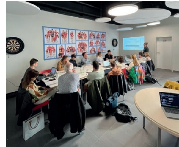
Masterclass Lokaal Sportbeleid – Dag 2: VTC De Mixx – Herselt.