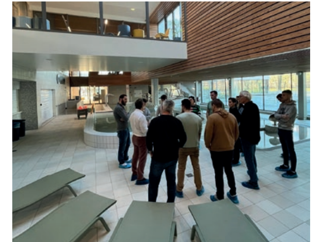
Masterclass Lokaal Sportbeleid – Dag 4: GC De Wildeman – Herent.