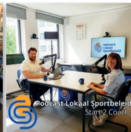
Podcast Lokaal Sportbeleid Start 2 Coach