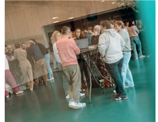
Voorjaarsvergadering - Wommelgem.

Elke ontmoeting bood ruimte om te netwerken en voor het delen van goede praktijken . Tot slot kregen de deelnemers de kans om de lokale sportinfrastructuur te ontdekken .