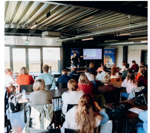
Najaarsvergadering - Middelkerke.