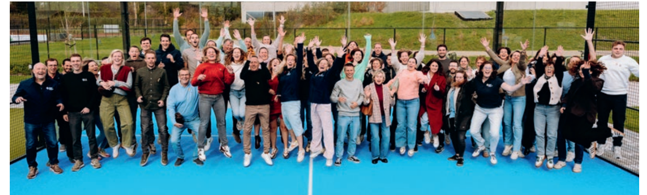
Provinciale afdeling West-Vlaanderen.

In onze werking wordt ook een belangrijke plaats ingenomen door diverse commissies en werkgroepen . Via commissies samengesteld uit diensthouders sport of beheerders, op basis van een vrijwillig engagement, kan Netwerk Lokaal Sportbeleid voor de concrete uitwerking van activiteiten of voor het formuleren van een standpunt in verschillende dossiers terugvallen op de kennis en ervaringen van het werkveld . De commissies en werkgroepen vormen zo een unieke bron van (ervarings-)kennis en een ideaal toetsingsinstrument bij de dagelijkse praktijk.