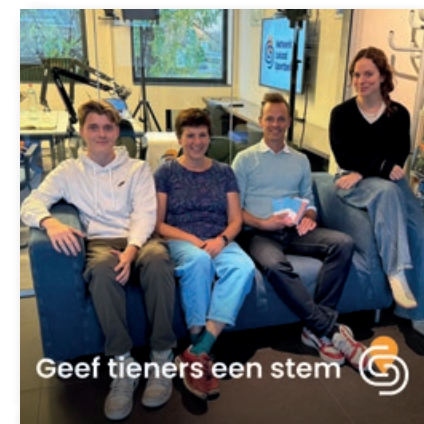
Geef tieners een stem