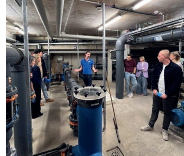
Masterclass Lokaal Sportbeleid – Dag 1: Stedelijk Zwembad Kapermolen – Hasselt.

In 2025 waren we te gast in Hasselt, Herselt, Genk en Herent.