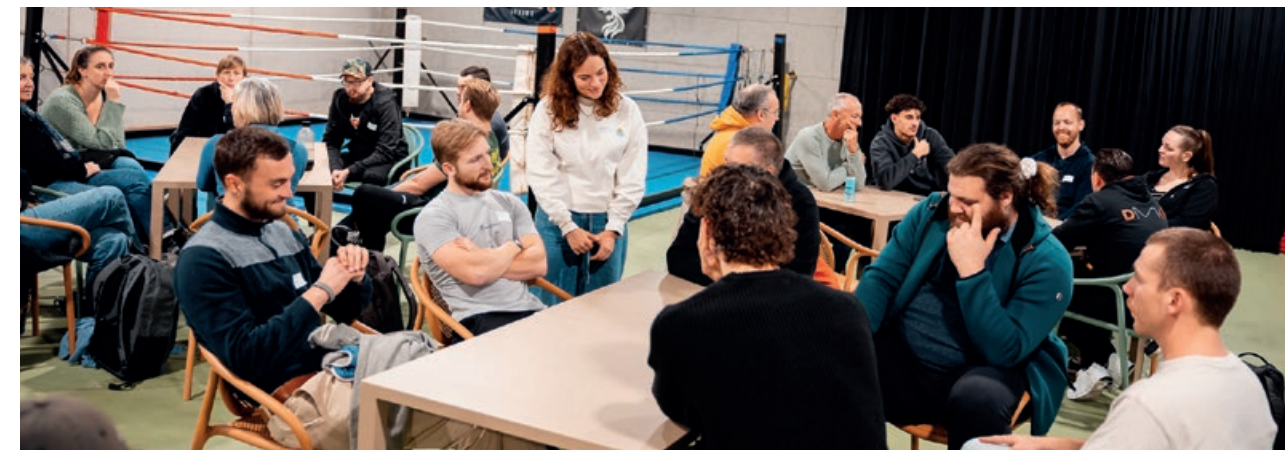
Trefdag Zwembaden - Sint-Truiden.