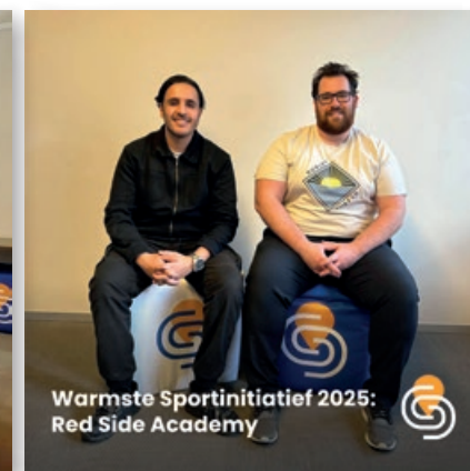
Warmste Sportinitiatief 2025: Red Side Academy