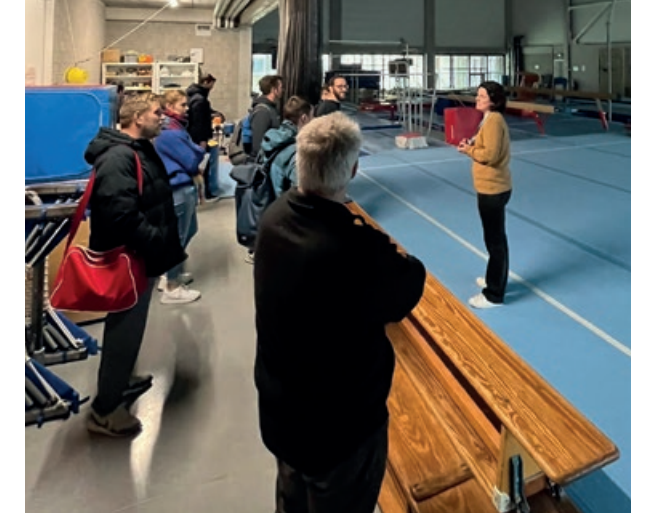
Masterclass Lokaal Sportbeleid – Dag 3: SportInGenk Park – Genk.